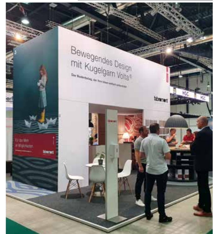
So präsentiert sich die Fabromont AG in 2023.